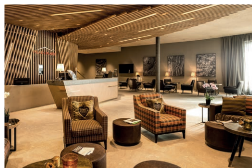
PEAKS PLACE, Apartment - Hotel & Spa, Laax