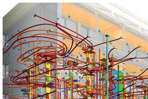
Mehrfamilienhaus Grünberg II, Chur (BIM)