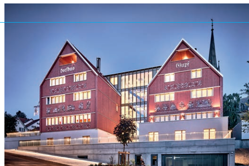
Dorfhus Gupf, Rehetobel