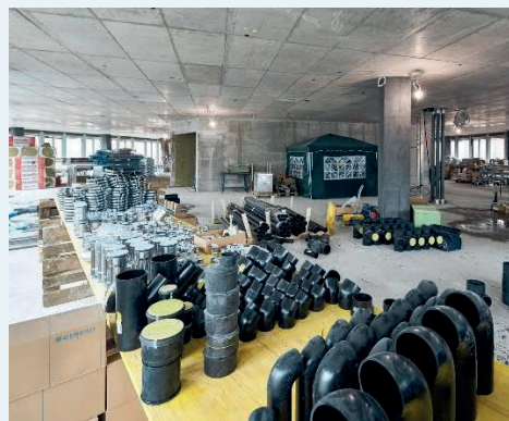
Dienstleistungsangebot entlang aller Phasen

Mit unseren Kompetenzen in Prozessführung und Projektmanagement, kombiniert mit breit abgestütztem technischem Know-how aus den umfassenden Fachdisziplinen, unterstützen wir unsere AuftraggeberInnen in allen Belangen entlang des Lebenszyklus ihrer Immobilie. Wir bringen unser Wissen und langjährige Erfahrung ein, damit die Gebäude und ihre immer komplexer werdende Technik nachhaltig optimiert werden. Die Zufriedenheit unserer AuftraggeberInnen und die Erfüllung ihrer Qualitätsansprüche sind unser höchstes Ziel.