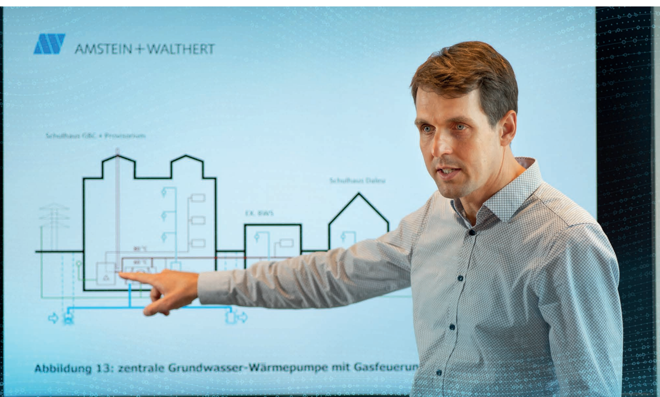
Abbildung 13: zentrale Grundwasser-Wärmepumpe mit Gasfeuerung