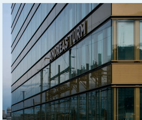
Aufbau und Führung des projektspezifischen Inbetriebnahme- und Abnahme-Prozesses