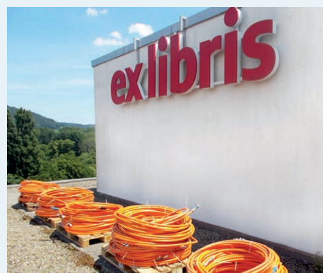
Bauherrenseitiges Projektmanagement für den Rückbau des Mieterausbaus im Ex Libris-Gebäude, Dietikon