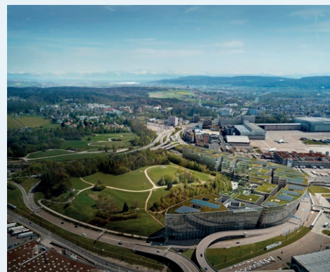
Koordination der Abschlussphase beim Projekt The Circle at Zurich Airport

Für den gesamten Lebenszyklus von Immobilien übernehmen wir im Projekt die umfassende Verantwortung. Als Projektmanager stellen wir sicher, dass alle notwendigen Schritte für eine erfolgreiche Umsetzung erkannt, eingeleitet und verantwortungsvoll bearbeitet werden. Wir unterstützen die Bauherrschaft bei der Organisation und Dokumentation des Projekts und geben kompetent fachlichen Input. Gemeinsam mit unseren Kundinnen und Kunden entwickeln wir mit fachlicher und sozialer Kompetenz die bessere Lösung. Wir beraten unabhängig und zielgerichtet und stärken die Bestellerkompetenz. Chancen werden genutzt und Risiken kontrolliert, während sich die AuftraggeberInnen auf ihr Kerngeschäft konzentrieren können.