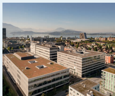
PbFM und Nutzervertretung für den Neu- und Umbau des Büro- und Produktionsgebäudes der Siemens, Zug mit Besucherzentrum und Labor