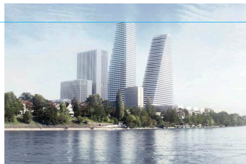
Roche Bau 2 und Projekt pRed, Basel