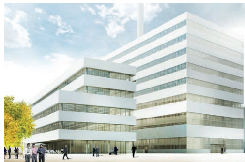
Roche Bau 8 und 11, Basel