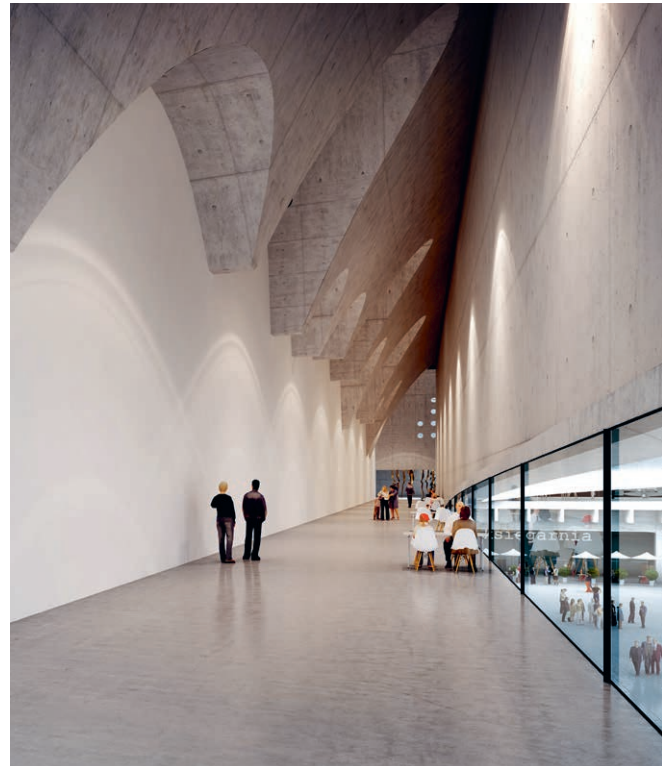
2 Natur und Kunstlicht unterstützen Architektur

Die Dramaturgie von Natur- und Kunstlicht unterstützt die gestalterischen Absichten der Architekten und der Kuratoren und muss situativ angepasst werden können, damit die Ausstellungsgegenstände und die Aufenthaltsräume attraktiv erscheinen.