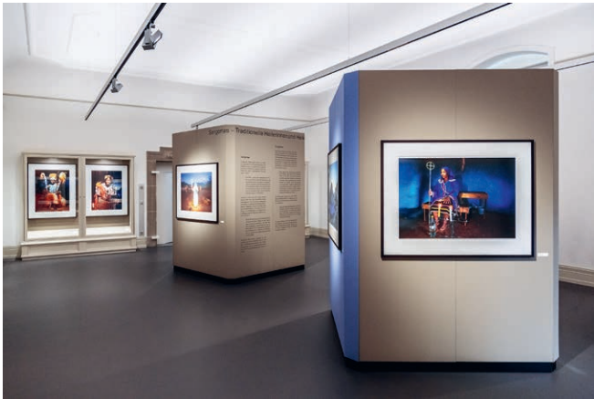
1 Kunst und Technik im Einklang

Die Attraktivität von Museen wird neben Ausstellungsgut, Standort und architektonischer Gestalt immer mehr durch eine erlebnisorientierte Präsentation der Ausstellungen und Sonderveranstaltungen geprägt.