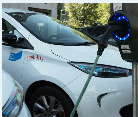
Plan de mobilité