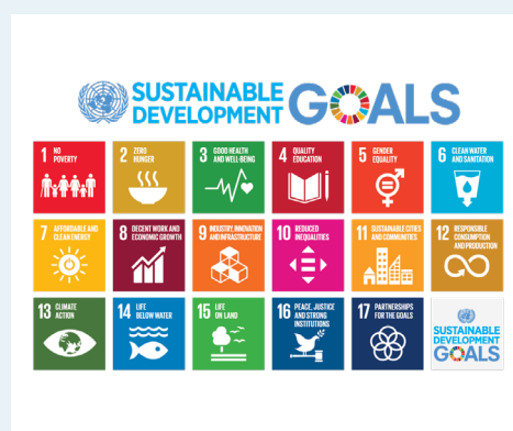
Les 17 Objectifs de durabilité de l'ONU