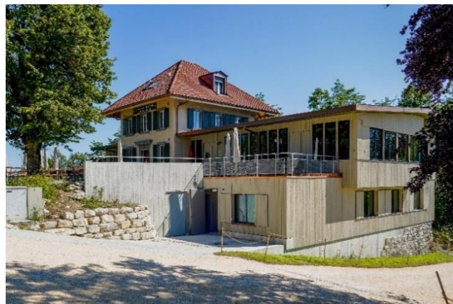
Restaurant Lägern Hochwacht

Seit über 120 Jahren befindet sich hoch auf der Lägern das traditionsreiche Restaurant Lägern Hochwacht . Durch den abgelegenen Waldstandort und die atemberaubende Aussicht lädt die Lägern Hochwacht seit jeher zum Wandern, zu Bike-Touren oder zum Verweilen ein. Seit der Ersteröffnung der Waldschenke im Jahr 1888 befindet sich das Ensemble der Lägern