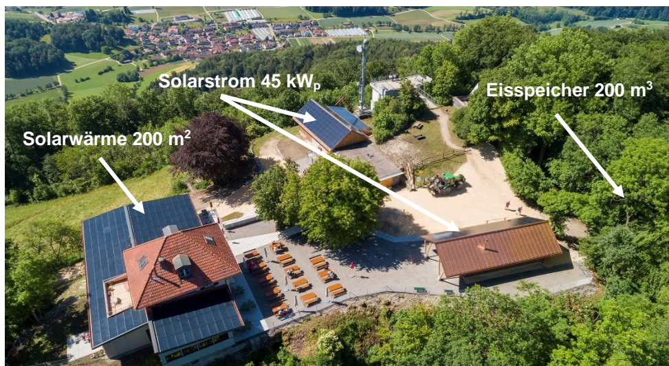
Läger Hochwacht mit solarer Dachnutzung

Die für den Restaurantbetrieb benötigte Energie für Wärme, Kälte und Strom erfolgt nun hauptsächlich über Belegung aller Dachflächen mit Solarkollektoren. Auf dem Dach des Restaurants wurden 200 m 2 thermische Solarabsorber mit Ost/West Ausrichtung installiert. Die Dächer der Nebengebäude sind als dachintegrierte PV-Anlagen ausgeführt. Auf dem Stallgebäude konnte eine PV-Anlage mit Ost/West Ausrichtung und einer Leistung von rund 33 kW p installiert werden. Diese wird um weitere 12 kW p mit einer nach Süden ausgerichteten PV-Anlage auf dem Dach der Waldschenke ergänzt. Somit beträgt die installierte Gesamtleistung am Standort 45 kW p . Für die Sicherung des Restaurantbetriebs im Falle eines Stromausfalls wurden die installierten PV-Anlagen mit einem Batteriespeicher zu einem Teillast-Inselsystem gekoppelt.