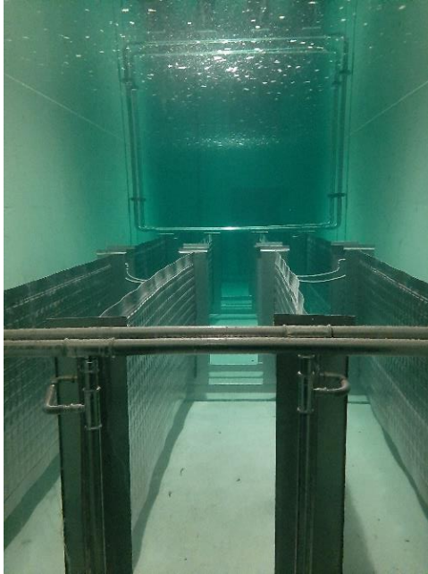
Eisspeicher mit Kissenabsorber

Mit einem Volumen von ca. 200'000 Liter dient der Eisspeicher dem System als saisonale Wärmespeicherung der thermischen Solarkollektoren, der Erdwärme und der Abwärme aus der gewerblichen Kälte. Für die Umfunktionierung des Militärbunkers wurden Edelstahl-Kissenabsorber Wärmetauscher der Firma Energie Solaire installiert, mit welchen der quaderförmige Bunker ohne tiefgreifende Abbruchmassnahmen erhalten blieb.